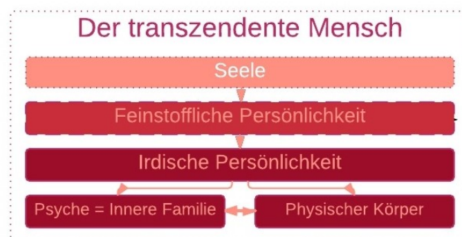
Abbildung-5: Der transzendente Mensch (Innere-Mann-Ansicht)

Die innerpsychische Gesundheit und Zugänglichkeit der einzelnen inneren Familienmitglieder sowie deren Kooperation untereinander bestimmen die individuelle Persönlichkeitsstruktur eines jeden Menschen. Aus dieser Persönlichkeitsstruktur heraus ergeben sich dann mit mehr oder weniger bemerktem Seeleneinfluss die persönlichen Wahrnehmungen, Beziehungs- und Lebensgestaltungen.