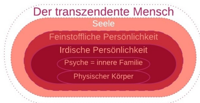
Abbildung-4: Der transzendente Mensch (Innere-Frau-Ansicht)

Die beiden folgenden Grafiken stellen die innere Familie im größeren Zusammenhang des transzendenten Menschen dar. Dabei veranschaulichen beide inhaltlich denselben Sachverhalt, aber die obere Abbildung entspricht dem Empfinden der inneren Frau und die untere Abbildung dem Verständnis des inneren Mannes. Daher wird die obere eher Betrachter/innen mit einer dominanten inneren Frau und die untere eher Betrachter/innen mit einem dominanten inneren Mann ansprechen.