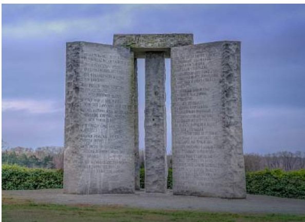
Bild: Georgia Guidestones von Dina Eric, https:// commons.wikimedia. org/w/index.php?curid=68014417

Ein Fundament für Verschwörungstheorien bietet die Geschichte und Bedeutung der Georgia Guidestones. Eine Broschüre zu den Georgia Guidestones liefert umfangreiche Informationen und diente mir hier als Quelle. Die Georgia Guidestones sind ein ca. sechs Meter hohes Monument aus Granitstein, welches auf einer Bodenplatte mit vier sternförmig platzierten Granitplatten und einer Deckelplatte auf einer Grundfläche von 45 Quadratmetern erbaut wurde. Auf diesen vier aufrecht stehenden Granitplatten sind auf jeder Seite eine Art zehn Gebote, Leitsätze oder Richtlinien in acht verschiedenen Sprachen